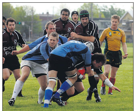
Sous la pluie, les Barracudas ont vaincu les Ravens, samedi dernier sur le terrain du Collège militaire royal.

Les personnes qui désirent être bénévoles peuvent faire parvenir un courriel à: e_spin22@hotmail.com .